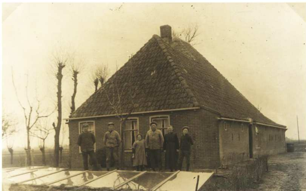
Cornelis Ooijevaar (10(2^05+ 0/1)) en Marijtje Zuiker met kinderen voor hun boerderij