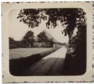
De boederij aan de Oosterwĳzend