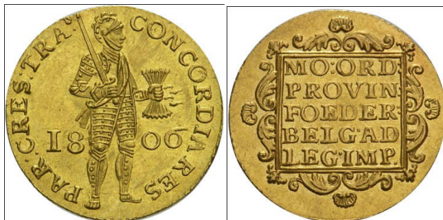
Gouden dukaat Utrecht goud, 21,5 mm., ± 3,5 gram.

MO(NETA):ORD(INUM):PROVIN(CIARUM):FOEDER(ATI):BELG(II):AD:LEG(EM):IMP(ERII) = Munt van de Staten van de Verenigde Nederlandse provincies volgens de wet van het Keizerrijk.